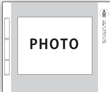
【横位置で展示の場合】